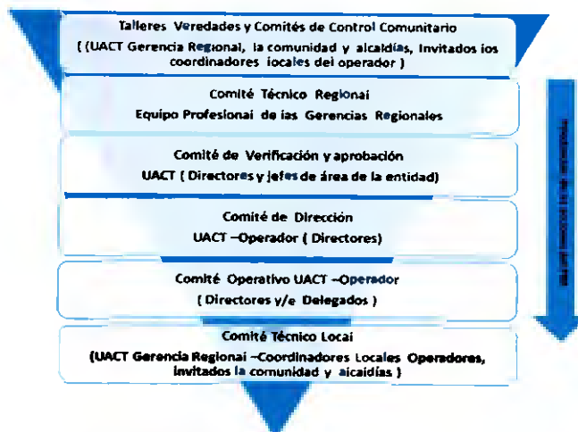
Gráfico 1 Instancias de decisión