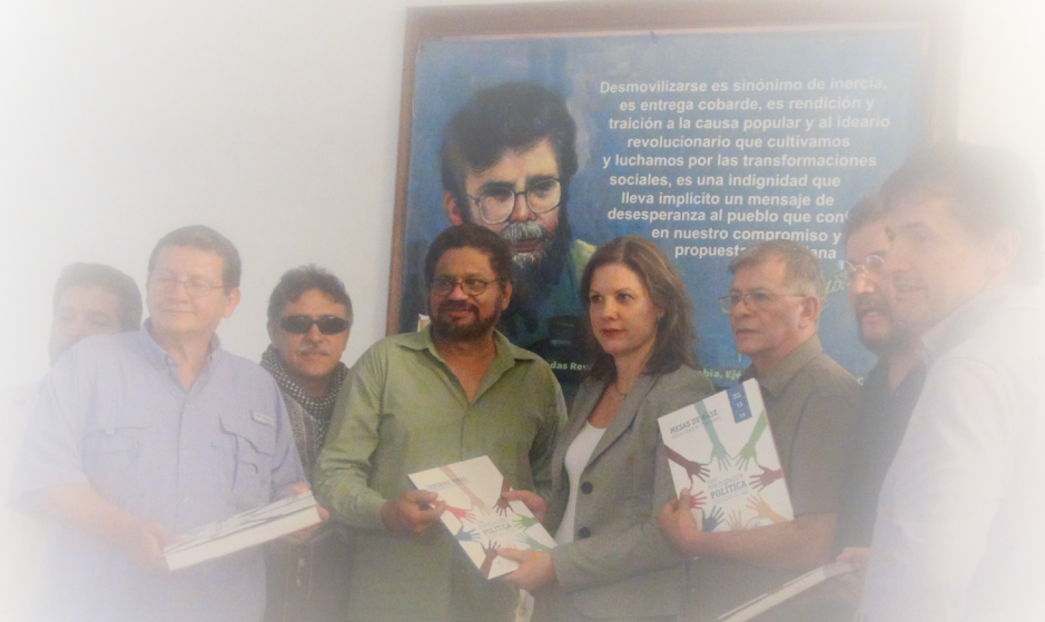
Momento en que Naciones Unidas y el Centro de Pensamiento de la Universidad Nacional entregan las Conclusiones del Foro de Participación Política a las FARC