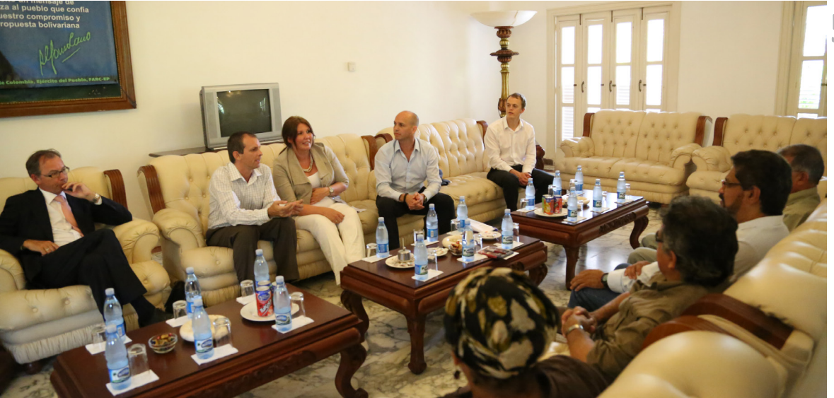
Representantes del gobierno de Noruega (garantes) dialogan con las FARC-EP