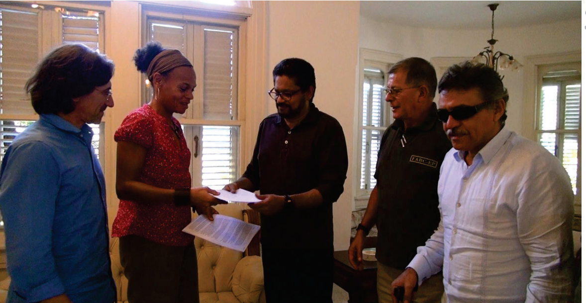
Intercambio de documentos entre el CICR y la Delegación de Paz de las FARC en La Habana