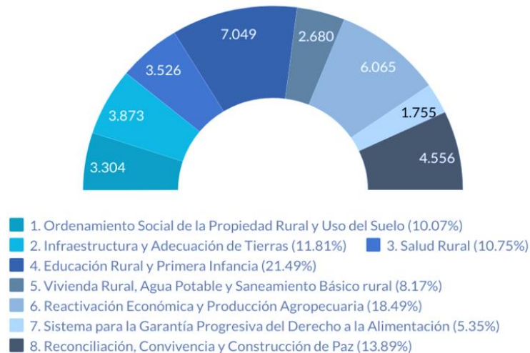
Gráfica 1 Número de Iniciativas por Pilar