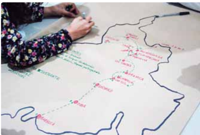
Nodo Andina Oriental. Bucaramanga, Santander. Octubre, 2017

Trabajar el universo emocional no es una tarea fácil. En particular, porque desde la Ilustración existe en el mundo occidental la tendencia a ocultar las emociones detrás de las razones que justifican una acción. Construir espacios de diálogo seguros para que la gente pueda compartir sus emociones es fundamental para aprender a tramitarlas. Lo importante es que el punto de partida sea el reconocimiento de