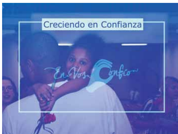
Herramienta pedagógica En vos Confío para niñez

Para reemplazar las narrativas y los imaginarios de la guerra por unas narrativas e imaginarios de la paz se necesita una intervención tanto en la consciencia política de los individuos, como en el inconsciente colectivo de la sociedad. Para lograrlo, es necesario recurrir a la pedagogía, a la comunicación social y al arte. Así se lograrán transformar los imaginarios heredados de la guerra, que regulan la vida social y hacen más difícil y lenta la construcción de paz 6 .