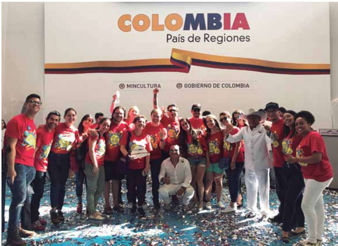
Lanzamiento de Canción La Confianza. Cali. Valle del Cauca. Julio 2018

El reto de este tipo de procesos, sin embargo, es que en general hay una falta de comprensión de la importancia de los proyectos que buscan transformaciones emocionales y culturales. Desafortunadamente, los imaginarios son vistos como un aspecto secundario que cambia si todo lo demás cambia. Nada más errado que esta visión. Hay una postura arraigada del “ver para creer”. Si algo se ha aprendido estos primeros años de transición de la guerra a la paz, es que si las aspiraciones de cambios estructurales no se acompañan de transformaciones en las narrativas y los imaginarios de los ciudadanos, y en su sentir, es muy probable que dichas aspiraciones se diluyan en la indiferencia de una sociedad que no se involucra emocionalmente con la construcción de paz, o que no ha tenido la capacidad de concebir una Colombia imaginada, en paz. Por ello, es indispensable seguir sumando esfuerzos que vayan encaminados a un “creer para ver” .