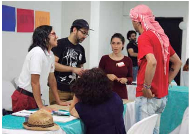
Nodo Andina Oriental. Bucaramanga, Santander. Octubre, 2017

transformar la realidad. Esto implica analizar las narrativas que utilizamos en la vida cotidiana para simplificar e imaginar el presente y proyectar el futuro. Para comprenderlo mejor es necesario desglosar qué entendemos por narrativas, dispositivos retóricos e imaginarios.