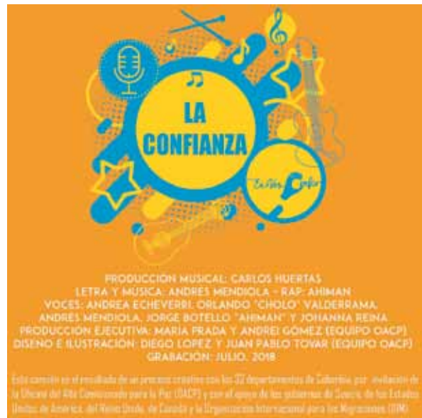
Portada canción La Confianza

Como resultado del trabajo colaborativo con aliados nacionales y territoriales se logró posicionar a través de la multiculturalidad del territorio nacional el mensaje desde diversas perspectivas: