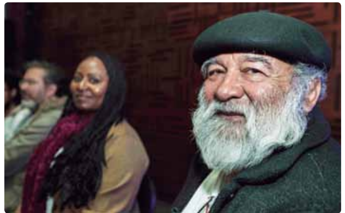
Reunión nacional con delegados de nodos. Bogotá. Marzo, 2018

Artistas: permiten comprender el universo emocional del territorio desde la estética. Su participación es fundamental porque desde su actividad tienen la posibilidad de tocar la sensibilidad humana. Al comunicarse con el inconsciente colectivo hacen posible re-significar los imaginarios que han prevalecido en el territorio. A través de su labor se puede generar una nueva relación con el espacio público, una nueva relación entre la ciudadanía y se pueden crear nuevos símbolos que sirvan de referente a todos los sectores poblacionales sin distinción.