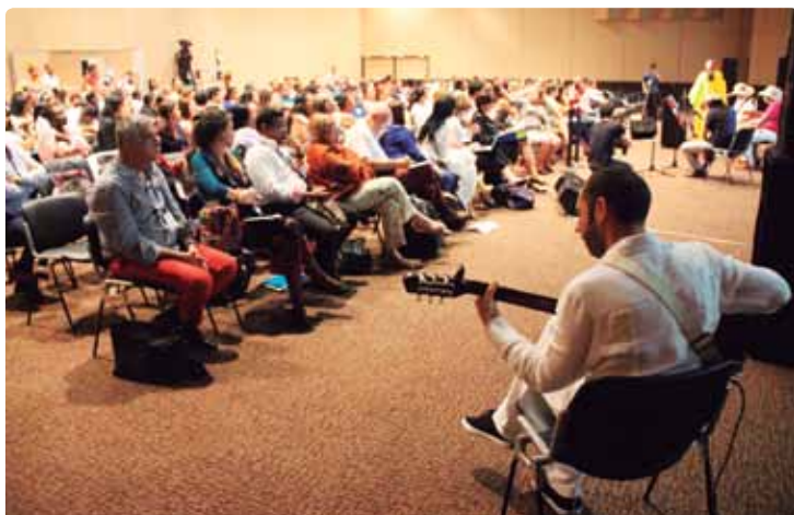
Nodo Caribe. San Juan de Nepomuceno, Bolívar. Octubre, 2017

La construcción de la cultura de paz pasa por el aprender y el desaprender. Y para ello es indispensable vincular a las personas en procesos pedagógicos que permitan un efecto palanca y complementen los procesos desde las comunicaciones. De esta forma se logran aumentar los esfuerzos y estrategias para la apropiación de las nuevas narrativas; a través de