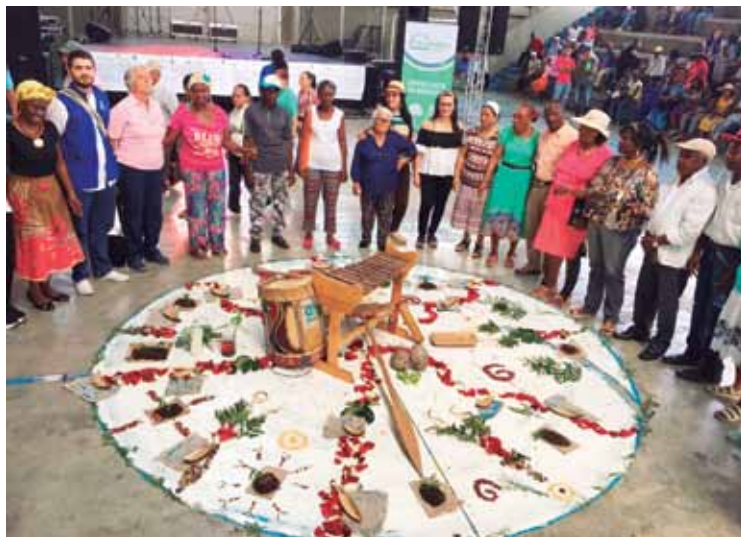
Nodo Pacífico. Buenaventura, Valle del Cauca. Septiembre, 2017

Dicha apropiación es fundamental para el reconocimiento de la importancia de nuevos mensajes y el proceso cultural que los soporta. Mostrar una convicción