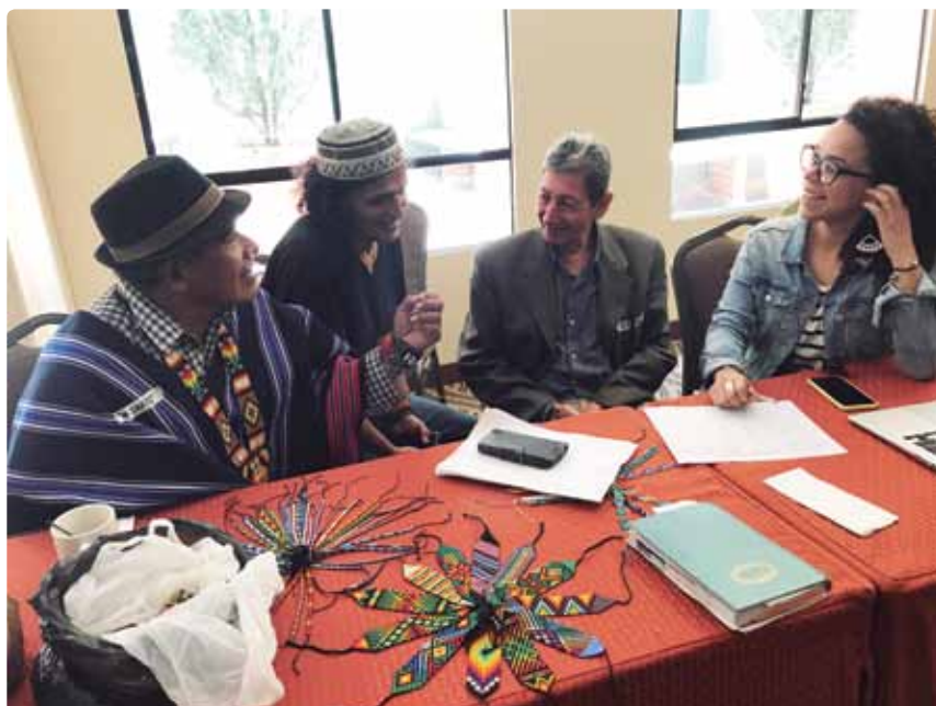
Reunión nacional con delegados de nodos. Bogotá, Marzo, 2018

Fundar una cultura de paz es un propósito que rebasa la responsabilidad de un sector, una comunidad o una región. El anhelo de cultura de paz requiere de estrategias nacionales de enseñanza formal y no formal que sirvan para fortalecer las capacidades para construir y vivir la paz (ver recuadro: Acción Capaz); así como de estrategias para trabajar en la producción de nuevas narrativas que transformen los imaginarios que echaron raíces durante el conflicto armado.