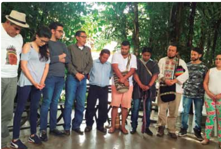
Nodo Amazonía. Florencia, Caquetá. Octubre, 2017

La metodología que se construye a partir de esta experiencia puede ser utilizada por los gobiernos territoriales, actores sociales, privados y de cooperación internacional para fortalecer la cultura de paz, la convivencia y la no-repetición y seguir profundizando en la transformación de otras narrativas e imaginarios regionales para la paz.