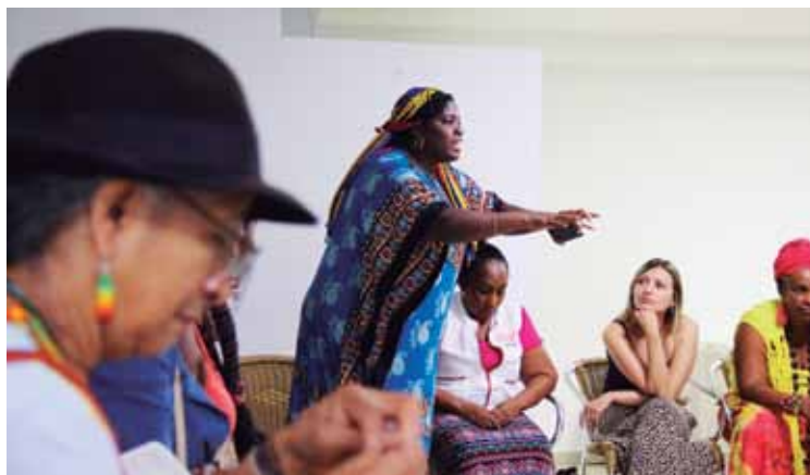
Nodo Pacífico. Buenaventura, Valle del Cauca. Septiembre, 2017

No obstante, en el plebiscito — mecanismo acordado entre el gobierno nacional y las FARC-EP para la refrendación del acuerdo de paz— con una abstención del 63%, por 40.000 votos, la mayoría de la sociedad voto “No”. Esto conllevó a una nueva fase de renegociación de los acuerdos y a la decisión de refrendar los acuerdos vía legislativa.