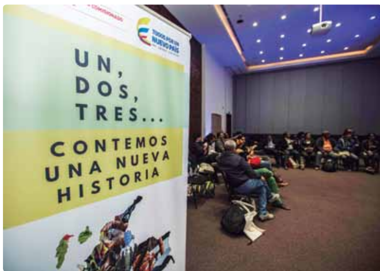
Taller Uno, dos, tres... contemos una nueva historia. Bogotá. Julio, 2017

En este proceso, se empezaron a consolidar las distintas miradas y propuestas desde los distintos territorios del país. Cada artista, cada comunicador/a, cada educador/a, cada persona fue una historia de vida y una experiencia social cargada de creatividad, resistencia y fuerza.