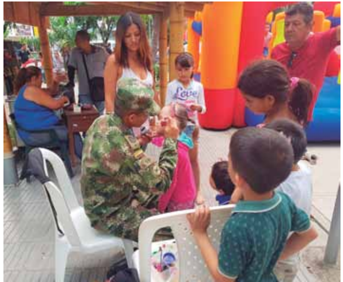
Nodo Andina Oriental. Bucaramanga, Santander. Octubre, 2017