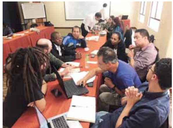
Reunión nacional con delegados de nodos. Bogotá. Marzo, 2018

Si se acepta que las emociones están asociadas con conceptos que se pasan de generación en generación, entonces es posible afirmar que transformar las emociones pasa por transformar el lenguaje. Es a través del lenguaje que colectivizamos nuestras emociones. Más aún hoy, en la sociedad de la información, en la que el Internet y las redes sociales están cambiando la forma como pensamos y sentimos. Por consiguiente, es necesario construir mensajes e ideas-fuerza que induzcan transformaciones en el universo emocional de la sociedad, haciendo posible la reconciliación.