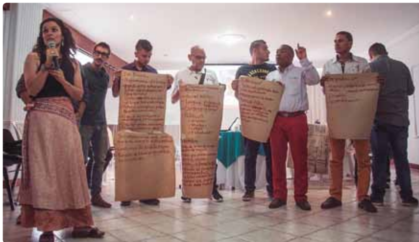
Nodo Andina Occidental. Pereira, Risaralda. Octubre, 2017

Conformar un grupo de creativos externos al proceso , con participación de los tres sectores —artistas, pedagogos y comunicadores—, es estratégico para valorar los mensajes que se proponen, así como las probables emociones que estos puedan generar. Este grupo de expertos sería un termómetro o filtro de la propuesta antes de construir las piezas de comunicación. Este paso permite hacer los ajustes necesarios de tal forma que los mensajes sean muy efectivos para generar un impacto emocional que permita transformar la realidad social.