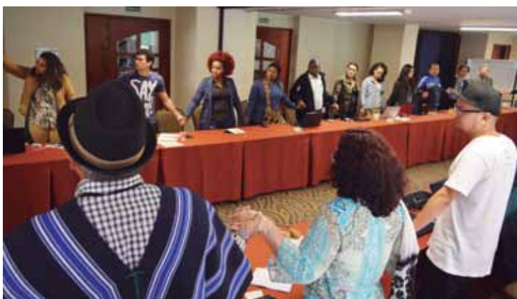
Reunión nacional con delegados de nodos. Bogotá. Marzo, 2018

Entre 1964 y 2016 Colombia vivió un conflicto armado entre el Gobierno y las Fuerzas Armadas Revolucionarias de Colombia, que en 1982 adicionaron a su nombre “Ejército del Pueblo” (FARC-EP). Este fue una de los conflictos más largos en el hemisferio occidental. Hoy en día aún persiste una parte del conflicto armado debido a la confrontación entre el Gobierno y el Ejército de Liberación Nacional (ELN), que empezó en 1965. Sin embargo, debido al exitoso proceso de paz con las FARC y a la negociación actual con el ELN, el país ha vivido los tiempos más pacíficos en el último medio siglo. Por esta razón, sin negar que persisten altos índices de violencia política 7 , algunos analistas de conflictos armados afirman que Colombia está en una transición de la guerra a la paz.