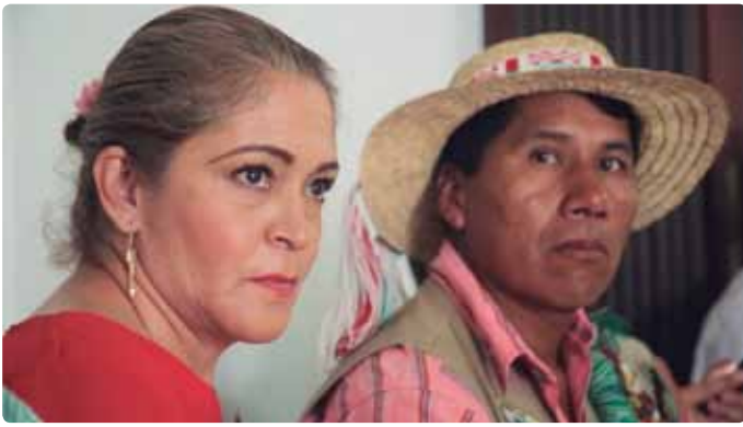
Nodo Andina Occidental. Pereira, Risaralda. Octubre, 2017

tienen una conexión directa o indirecta con un importante número de actores de la sociedad que tradicionalmente no están tan directamente conectados con las discusiones sobre la construcción de paz; por ejemplo, estudiantes, docentes, gestores culturales y la ciudadanía en general, que es impactada a través de los medios de comunicación. Por esto, tienen una capacidad de influencia importante que permite involucrar a un amplio porcentaje de la sociedad en la construcción de nuevos imaginarios, narrativas y comportamientos en pro de la transición de la guerra a la paz.