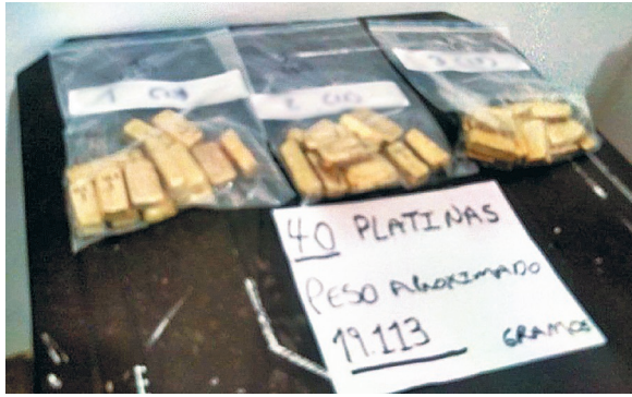
Las 40 platinas de oro que la antigua guerrilla entregó el pasado 20 de marzo en Ituango (Antioquia).

» A través del decreto 903 del 29 de mayo de 2017, el Gobierno creó un patrimonio autónomo que servirá de receptor de todos los bienes de las Farc para reparar a las víctimas. Dicho fondo lo administra la SAE.