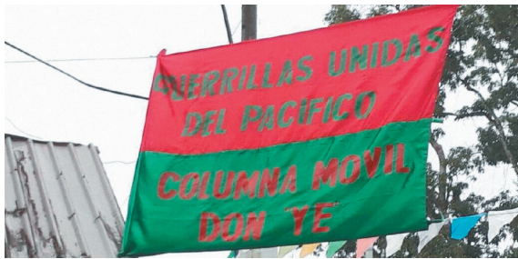
Bandera de las Guerrillas Unidas del Pacífico (GUP).