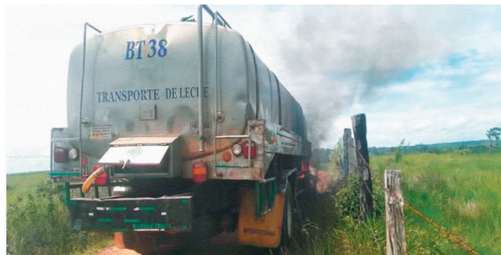
Quema de un camión lechero (10 de junio de 2017) en San Vicente del Caguán, Caquetá.

La mayoría de disidencias usan la etiqueta Farc-Ep, sus brazaletes y los nombres de los antiguos frentes de la guerrilla.