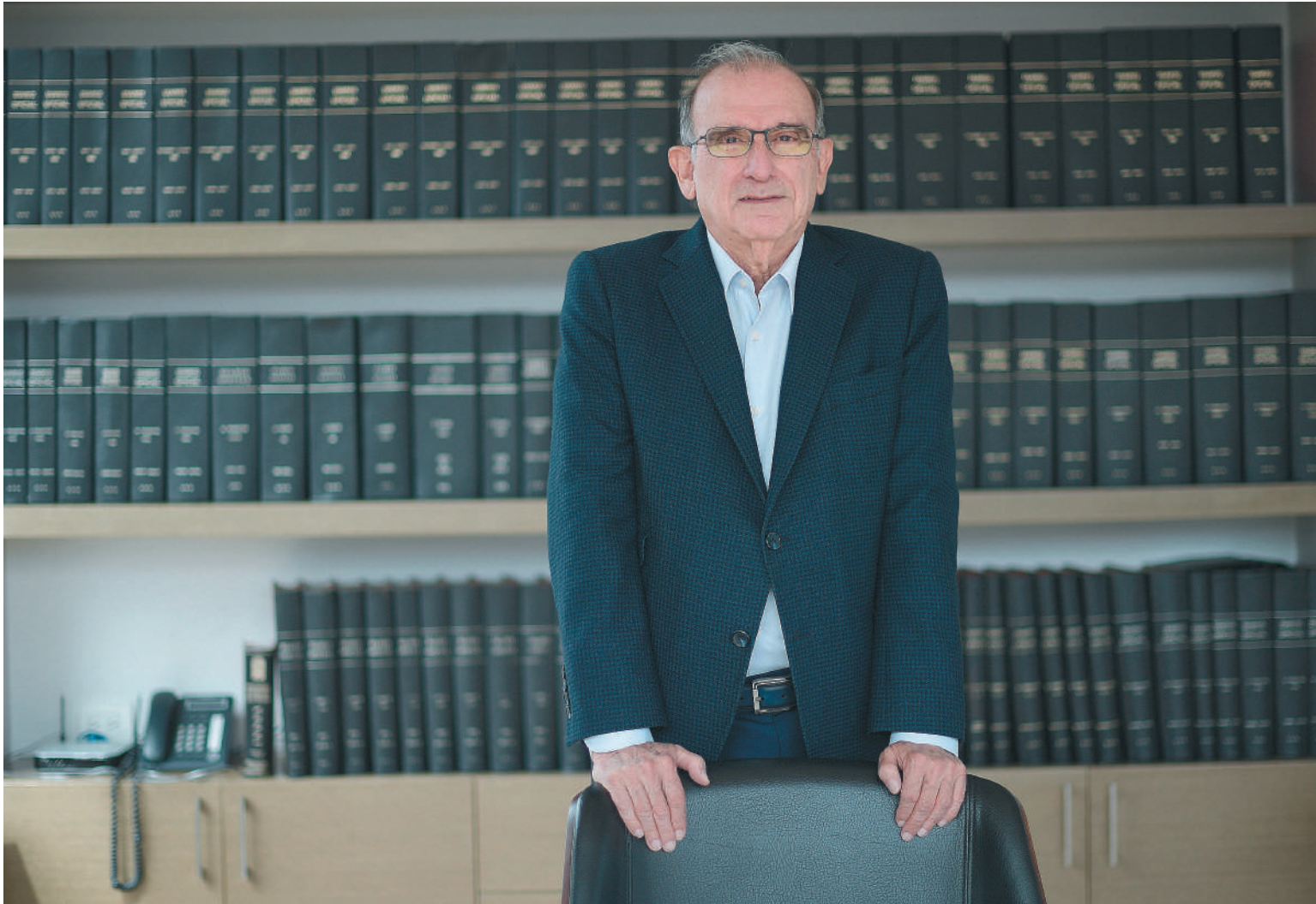
El exjefe negociador de paz del Gobierno Humberto de La Calle.