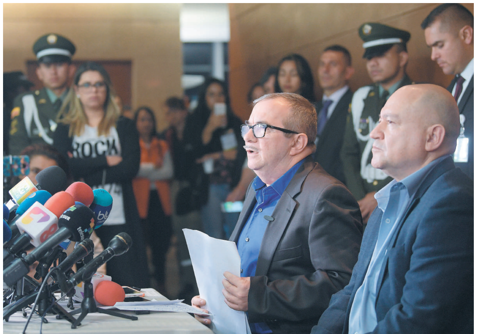
El 13 de julio de 2018 tres excomandantes de las Farc se presentaron ante la Jurisdicción Especial para la Paz y se abrió el caso 001.

Cuidado que, reiniciada total o parcialmente la confrontación, no nos veamos enfrentados a una diáspora de criminalidad muy parecida a la linaza que se riega y no es posible recogerla, salvo mediante un largo y seguramente doloroso proceso de conflicto más o menos duradero. ¿Una década? ¿Dos? ¿Cuántas nuevas víctimas? ■