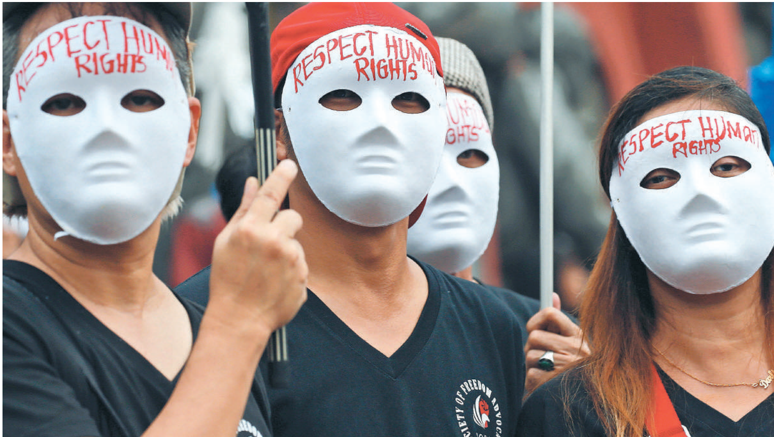
La negociación del tratado, aunque puede durar años, tiene el apoyo de varias organizaciones sociales de todo el mundo que apoyan la iniciativa.

El autor es un grupo de trabajo del Consejo de Derechos Humanos de la ONU