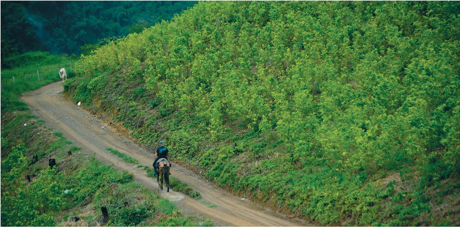
Del programa de sustitución voluntaria de cultivos actualmente hacen parte 124.745 familias de 14 departamentos del país.

» 47.910 familias ya sustituyeron sus cultivos y en algunos departamentos ya están recibiendo los pagos que se habían acordado, es decir cerca de $1'200.000.