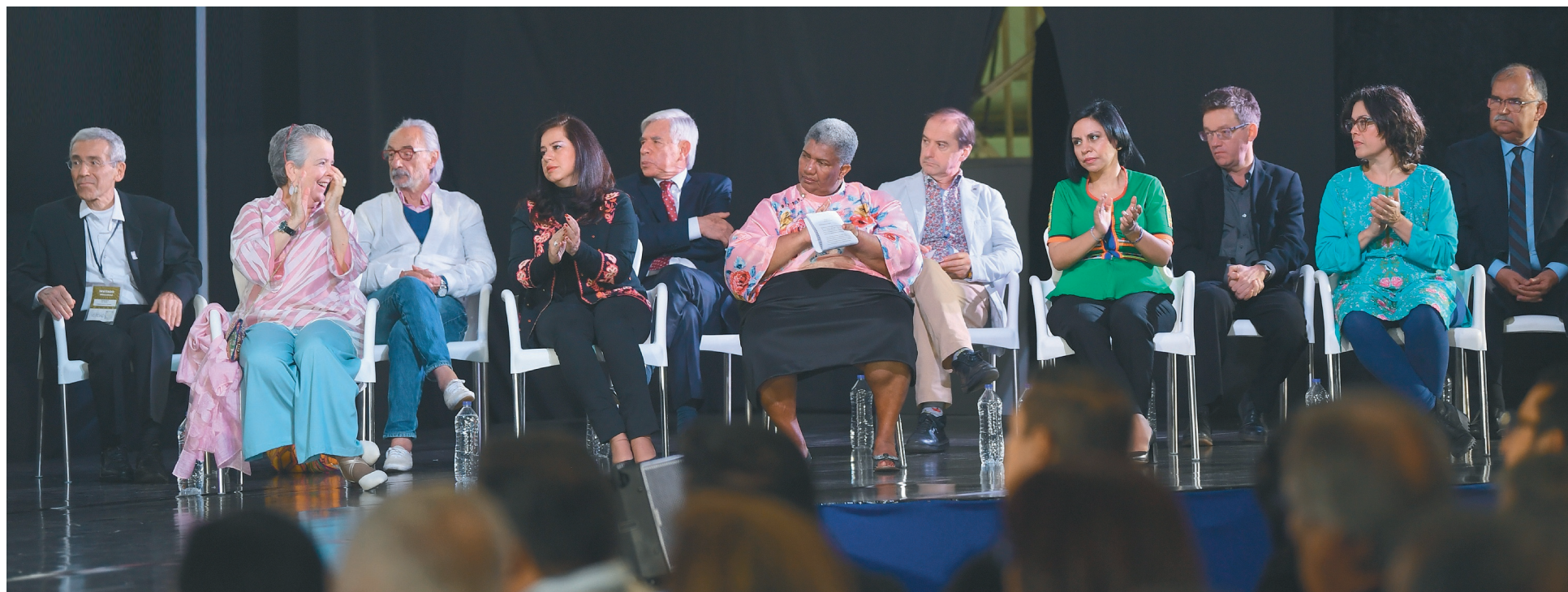
Los comisionados y comisionadas de la verdad son 11 y tendrán un mandato de tres años. / Cristian Garavito