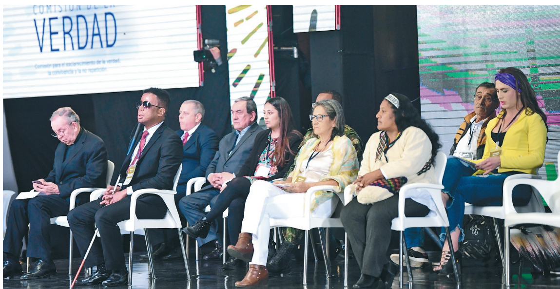
Los invitados a expresar su compromiso con la verdad, en este lanzamiento, fueron trece personas, once de ellas víctimas del conflicto de todos los sectores. / Cristian Garavito

Es periodista. Ha cubierto los procesos de paz con las Farc y el Eln y los procesos de paz territorial.