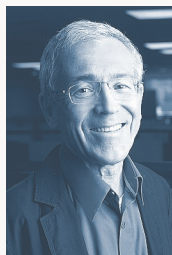
Francisco de Roux.

Presidente de la Comisión. En 1975 se ordenó como jesuita. Luego fundó la Corporación Desarrollo y Paz del Magdalena Medio.