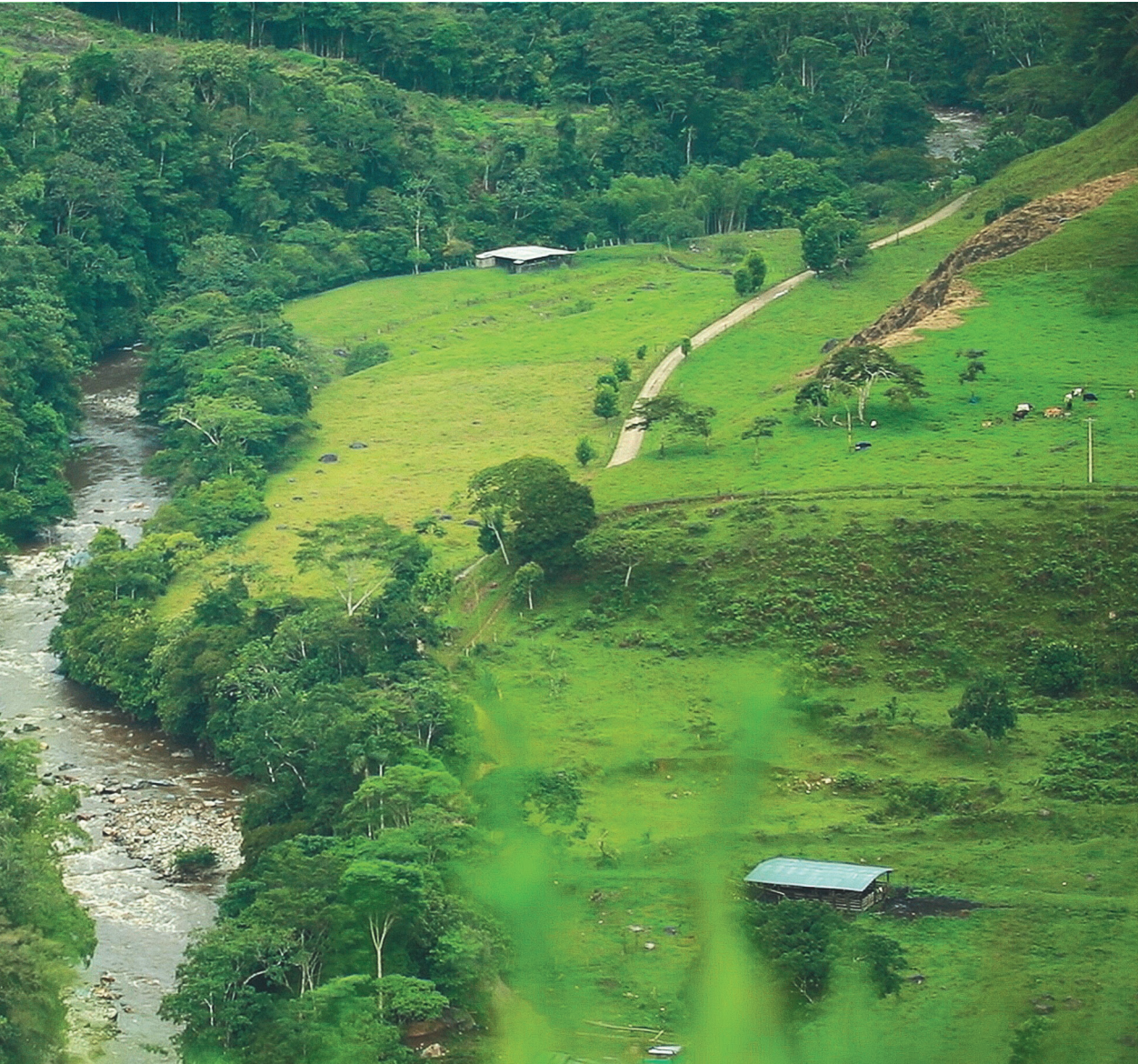
El cañón del río Pato, en Caquetá, eje del proyecto ecoturístico de los excombatientes de Miravalle.