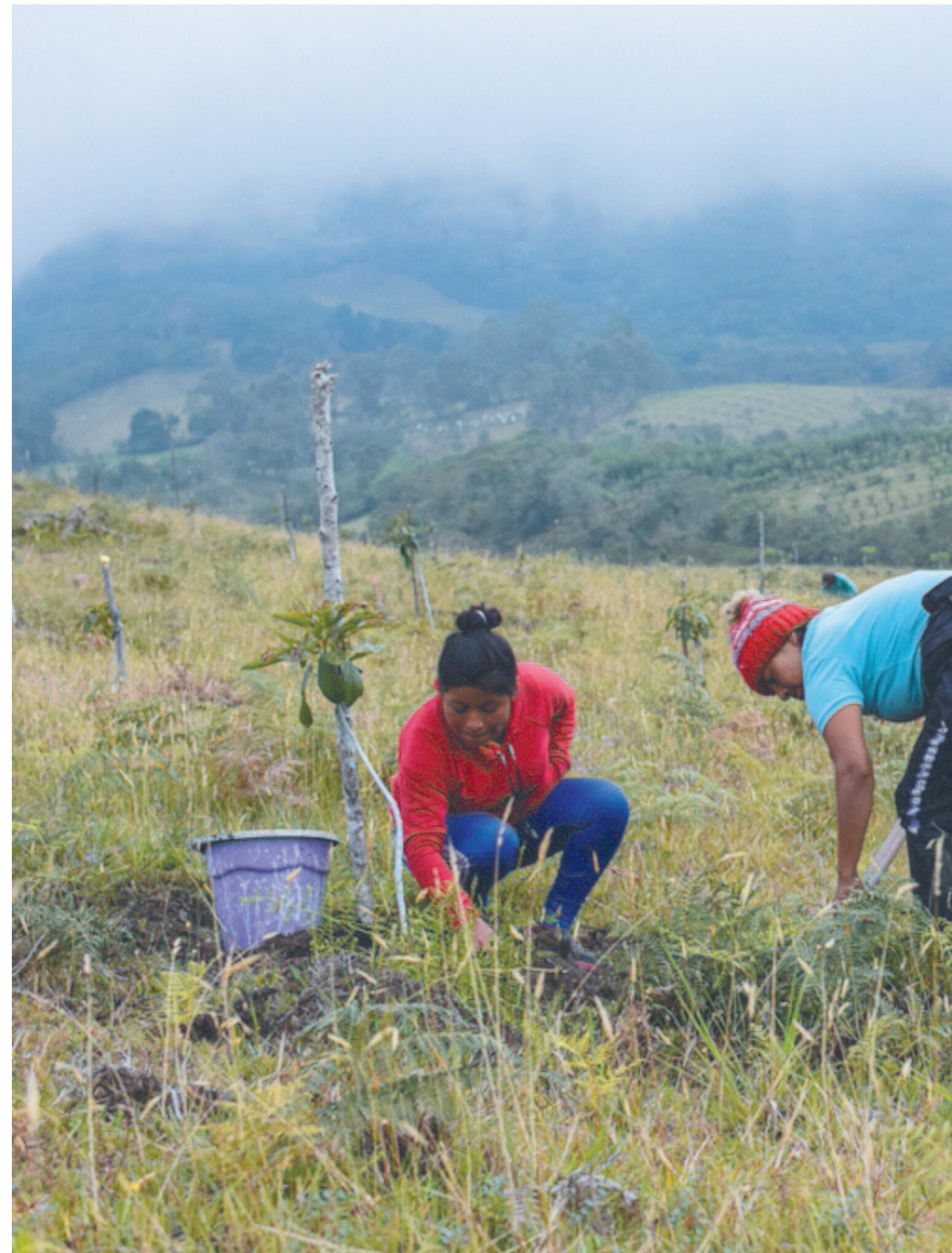
Las tierras pertenecen al resguardo indígena de Tumburao y de acuerdo a un comodato a 25 años se las facilitaron para el cultivo de aguacate y para un proyecto de Piscicultura.