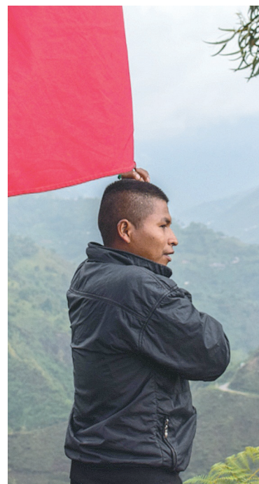
La Guardia Indígena sigue defendiendo su territorio de la presencia de grupos armados y narcotraficantes.

“En el Cauca hay 16 o 13 grupos armados, dependiendo de donde se para uno. Cada uno tiene 100 militantes o 1.300 hombres armados. Si el 95 % de los excombatientes en el Cauca están [acogidos al proceso de paz], solamente tenemos 30 embolotados. Es decir, que los 1.200 son personas de la comunidad que no tienen alternativas y que han encontrado en la guerra una forma de sobrevivir”, añade.