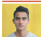
SEBASTIÁN FORERO RUEDA

sforero@elespectador.com @SebastianForerr