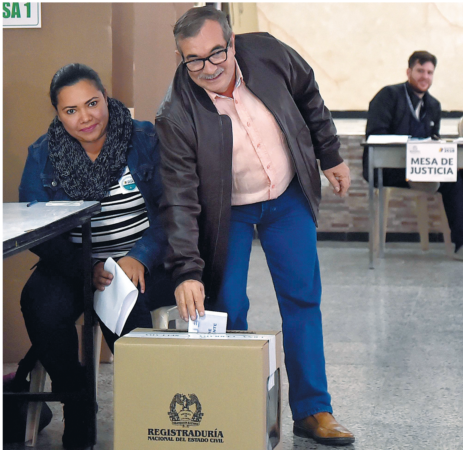
El asesinato de excombatientes de las Farc y de líderes sociales son las principales amenazas a la apertura democrática del Acuerdo de Paz.

militantes de ese partido en Argelia (Cauca).