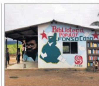
Más de 3.000 antiguos combatientes de las FARC de Colombia viven en zonas acotadas para preparar su reintegración en la vida civil y cuya figura jurídica expira en agosto

AGENCIAS Ciudad de Guatemala El Gobierno de Guatemala anunció ayer la suspensión de la reunión que estaba prevista para hoy entre el presidente Jimmy Morales y su homólogo de EE UU, Donald Trump, en Washington. A través de un comunicado, el Gobierno dijo que debido a las acciones antirrefugiados que ha sido ordenadas para su llegada en la Corte de Constitucionalidad "se decidió reprogramar el encuentro bilateral hasta después de las elecciones presidenciales, antes de una reunión de instancia jurídica en contra del presidente Morales y sus ministros de Exteriores y del Interior, Andrés Barrantes y Rigoberto Ríos, respectivamente, para evitar que Guatemala se convirtiera en tercer país de origen -aunque que proceda a expulsar a refugiados que piden asilo por su territorio- para migración. En el documento, la Administración de Migración asegura que durante su gestión ha mantenido una "neutral" relación bilateral con el Gobierno de EE UU. "Ambos países