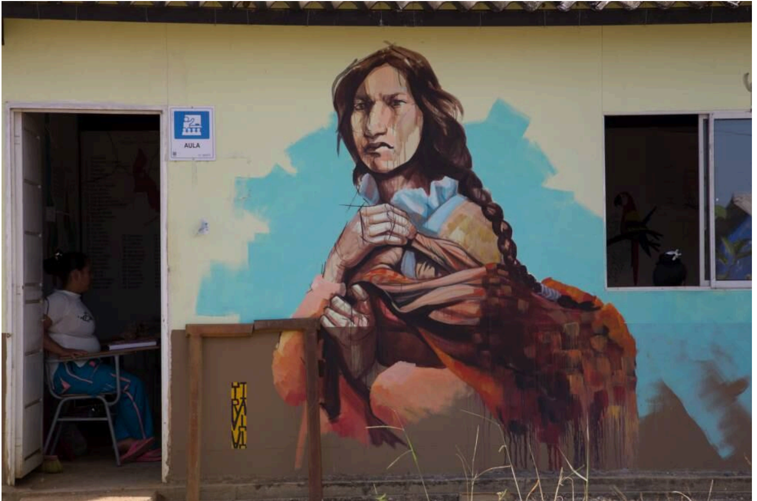
Este año se organiza el tercer festival de muralismo en Agua Bonita. FONDO EUROPEO PARA LA PAZ

problema de la tierra: la comunidad se organizó para ahorrar y comprar la propiedad de 165 hectáreas donde llevan a cabo sus proyectos productivos.