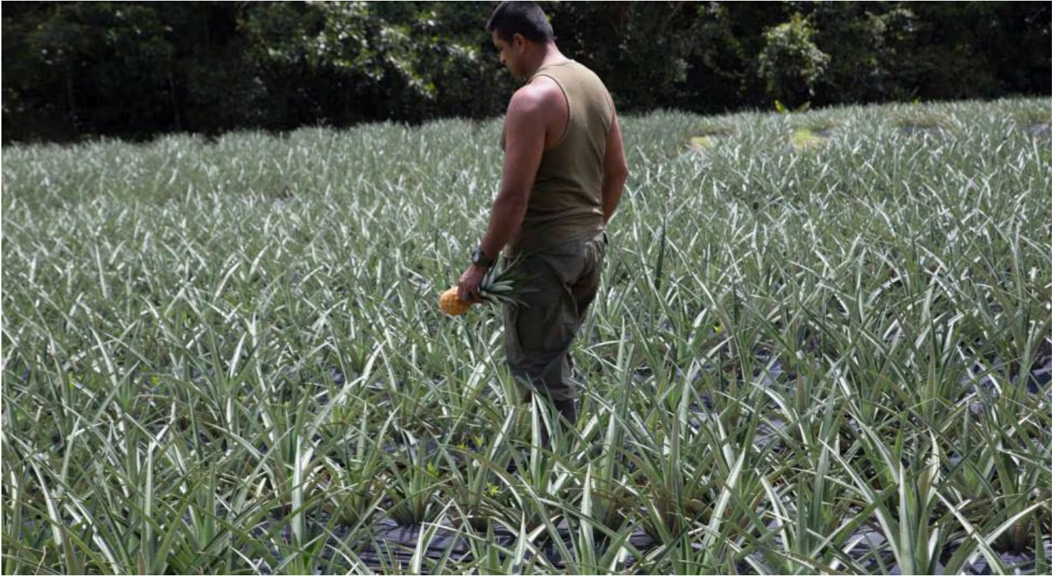
Un excombatiente recorre el cultivo de piñas en el ETCR de Agua Bonita.

Agua Bonita es una de las zonas en las que los excombatientes se concentraron para dejar los fusiles , que después dieron paso a lo que en la jerga gubernamental se conoce como un Espacio Territorial de Capacitación y Reincorporación (ETCR). En total son 24 a lo largo y ancho del país, que aún albergan a 3.296 de los 13.000 exguerrilleros en proceso de reintegración. Aunque no están confinados en estas zonas, muchos quieren quedarse. En varias viviendas se apilan los ladrillos para reemplazar los endebles materiales con los que se construyeron en un primer momento.