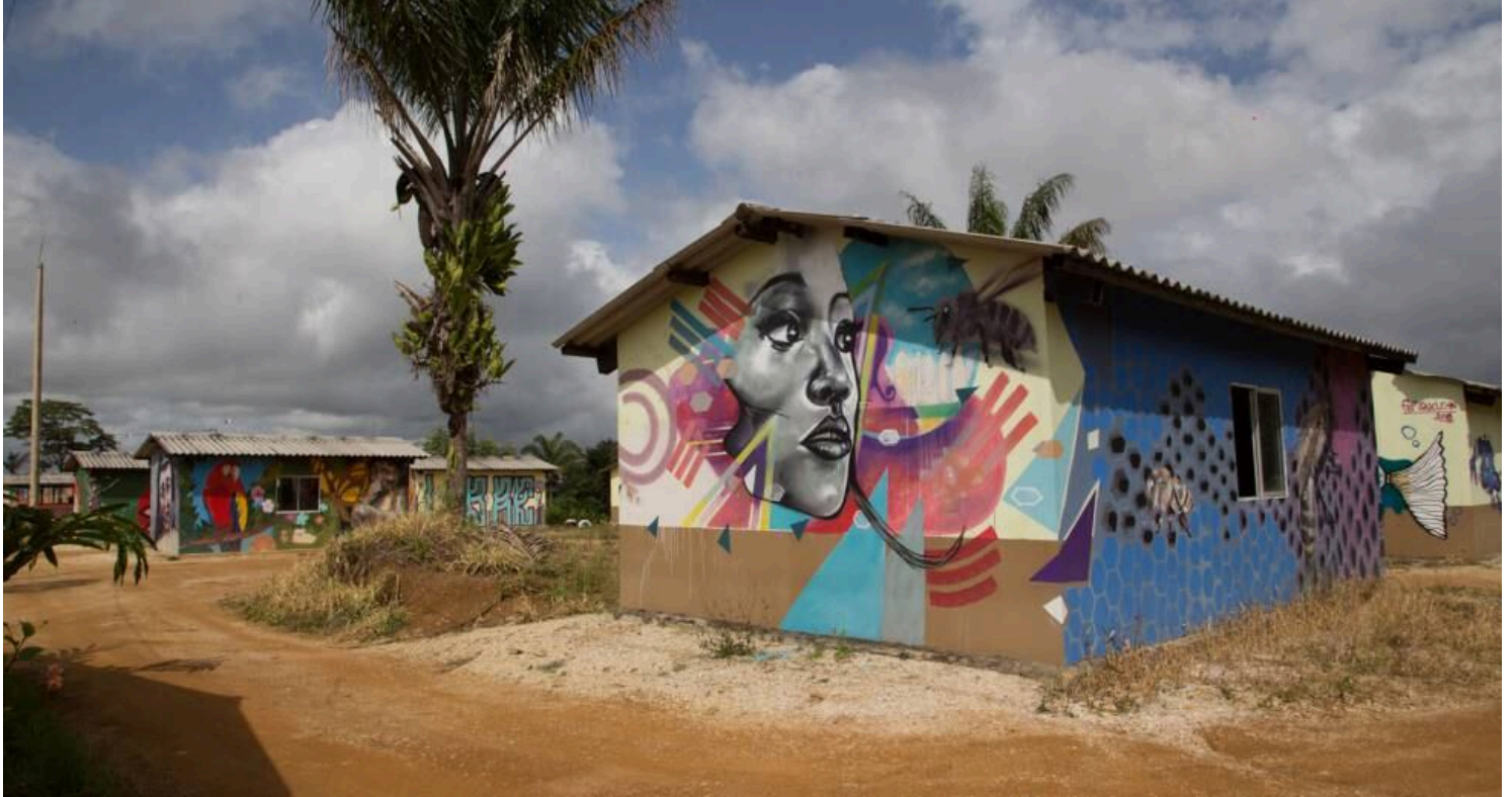
Las paredes de las viviendas de Agua Bonita están decoradas con coloridos murales. FONDO EUROPEO PARA LA PAZ

incluyen todo tipo de estudiosos y formadores. También universidades que desean acompañar la construcción de la paz, desde la Nacional, la gran institución pública del país, hasta La Sábana, privada y de corte conservador.